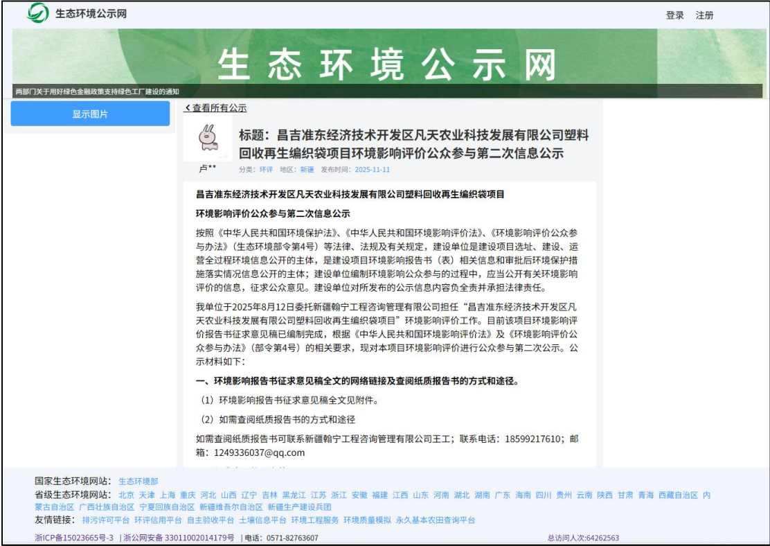
图 2 本项目征求意见稿网络公示截图

五家渠红旗农场润宸滴灌带厂分别于 2025 年 12 月 11 日及 2025 年 12 月 13 日在中国税务报对项目的环境影响评价信息进行了两次公告。