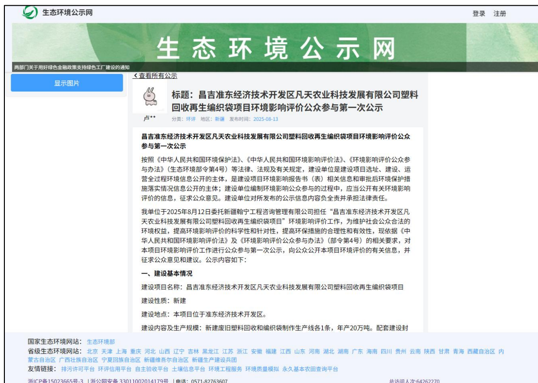
图 1 本项目第一次网络公示截图