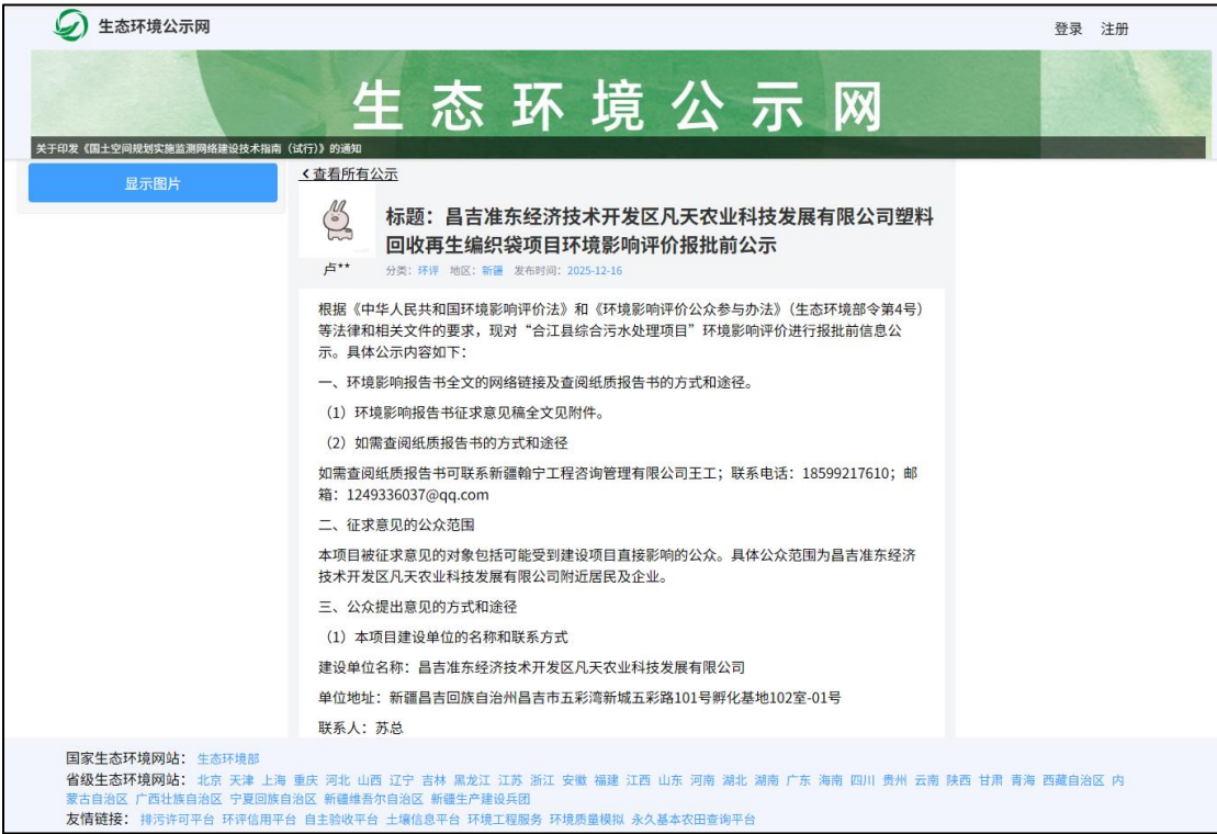
图 4 公示现场照片

征求意见稿公示期间，公示信息处于公开状态，公示公开期间未收到公众通过现场、网络、电话及书信等方式提出的意见。