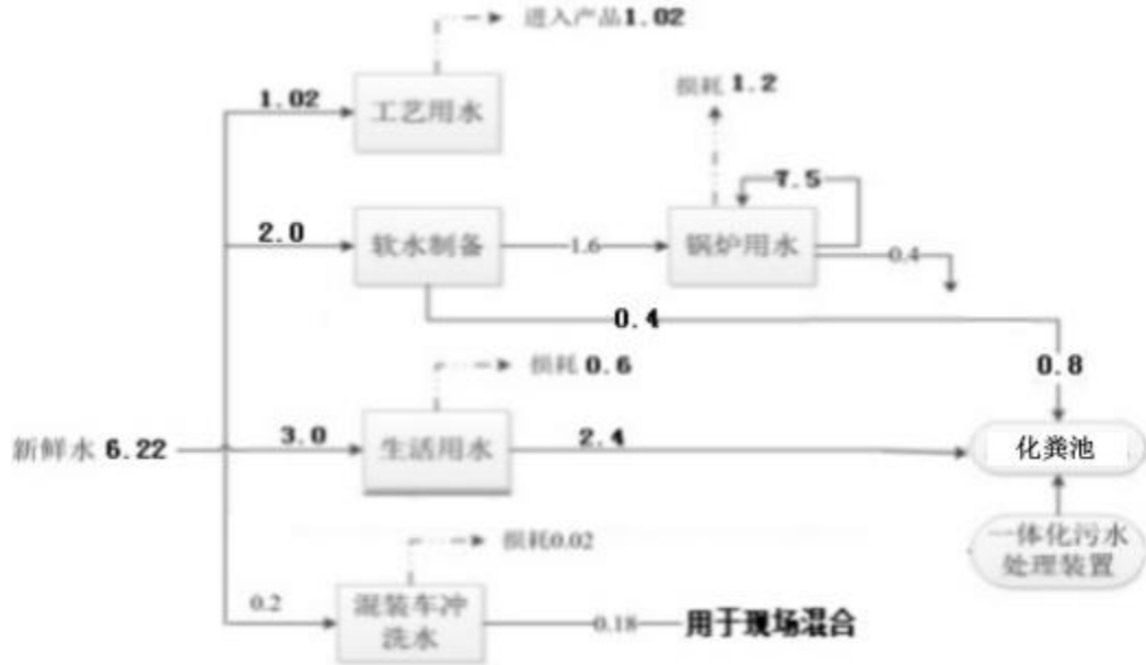
图 4 项目水平衡图 单位: m 3 /d